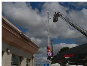
Instalação de Câmaras exteriores