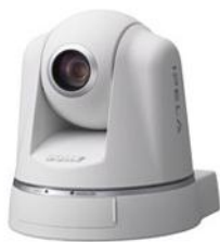
Câmara Sony SNC- RZ50P

A solução é constituída por 4 Câmaras IP Sony SNC- RZ50P e o respectivo software de gestão RSM – Realshot Manager.