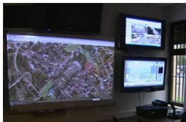
Posto de Observação